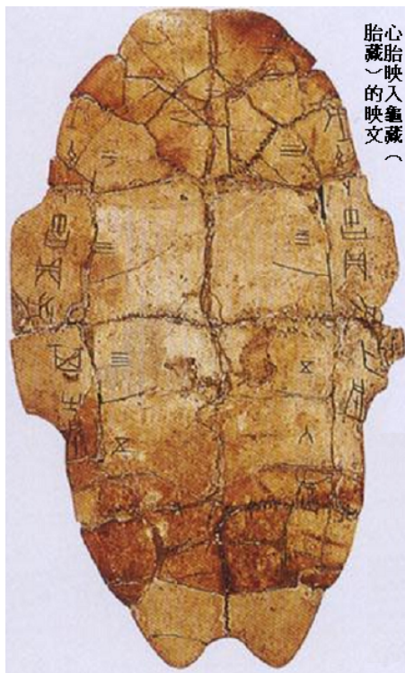
心胎映入龜藏（胎藏）的映文

【註】巴比倫正史記載：公元前2282年原住兩河流域的蘇美人，打了一場勝仗後，舉族東遷，越蔥嶺，往東而去。又，間隔四千多年，左圖中寫著「蘇美楔型文」的甲骨文化，在我國河南省出土。